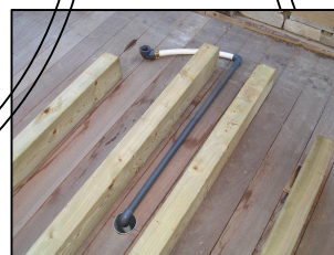
Détails du raccordement entre la bonde du bain et votre vidange